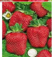
Fraisier Mme Moutot

Variété ancienne non-remontante. Gros fruit, très sucré, saveur authentique. Son feuillage est persistant en climat doux.