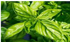
Basilic Grand vert

Plante annuelle au port buissonnant de 50 cm de hauteur. Feuillage vert foncé et brillant, gaufrées, grandes et larges. Très productif et très parfumé.