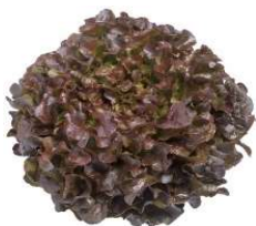
Feuille de Chêne rouge Alonix

Résistance totale au mildiou. Feuille de chêne rouge volumineuse avec une belle couleur cerise intense. Plante bien équilibrée. Remplissage progressif (bonne attente au champ). Large créneau d'utilisation.