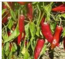
Sucette de Provence

Originaire du bassin méditerranéen et d'Amérique latine. Le fruit est effilé et allongé d'environ 10 cm de longueur, de couleur verte devenant rouge brillante. La chair est fine et piquante.