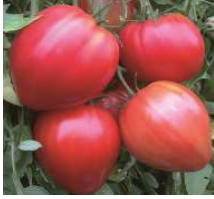
Cœur de bœuf

Mi-précoce. Fruits rouges de 300 à 700 g particulièrement charnue et délicieuse. Variété très productive et régulière. Généralement, les plants de Cœur de bœuf sont plus graciles que les autres variétés.