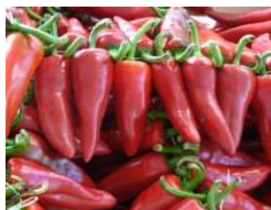
Gorria (dit d'Espelette)

Des Basques partis à la conquête du Nouveau Monde ramenèrent le piment "Gorria" (rouge en Basque). Plante de 1 m de haut, jusqu'à 15 fruits par pied (environ 500 g de fruits). Fruit rouge de forme conique de 10 à 14 cm de long.