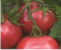
Rose de Berne

Mi-précoce. Fruit charnu et rustique, à léger collet vert de 140 à 170 g. Peau fine rose et chair carmin. Très sucrée mais se fendille aisément. Une des tomates roses les plus aromatiques, douce et sucrée.