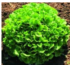
Feuille de chêne blonde Lenir

Résistance totale au mildiou. Variété volumineuse, lourde et poussante en conditions difficiles. Dessous rond et sain, récolte facile. Bon comportement à la tâche orangée et au Pythium.