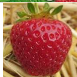
Fraisier Rubis des Jardins

Variété rustique, son fruit couleur rubis, brillant et de forme conique court. Chair ferme, sucrée et acidulée.