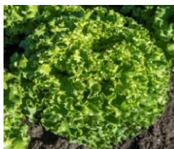
Batavia Blonde Godzilla

Résistance totale au mildiou. Batavia type pomme ouverte de présentation traditionnelle. Remplissage lent, bonne tenue au champ. Variété vigoureuse adaptée pour les conditions de printemps précoce et d'automne tardif. Bonne tolérance au Tip Burn.