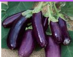
Violette de Toulouse

Précoce. Fruit long et cylindrique d'une longueur de 20 à 22 cm, de couleur violet clair, à la chair blanche et douce. Variété très productive.