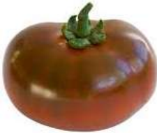
Noire de Crimée

Mi-précoce. Plante vigoureuse aux feuilles larges et épaisses. Fruit de 120 à 150 g pouvant atteindre 350 g, de couleur rouge-brun foncé virant au pourpre. Chair dense et légèrement sucrée avec peu de graines. Très productive et très bonne résistance à la sécheresse.